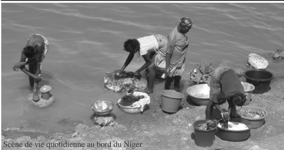
Scène de vie quotidienne au bord du Niger

Entre leurre et espoir, Le Ventre de l'Atlantique s'étale de l'Europe à l'Afrique, entrecroisant les destins contrastés de personnages saisis dans le tourbillon des sentiments et marqués par la douleur d'un exil quasi inéluctable. Car, même si la souffrance de ceux qui restent est indicible, il s'agit de partir, vivre libre et mourir comme une algue de l'Atlantique.