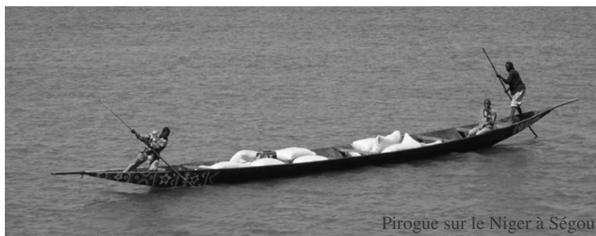
Pirogue sur le Niger à Ségué