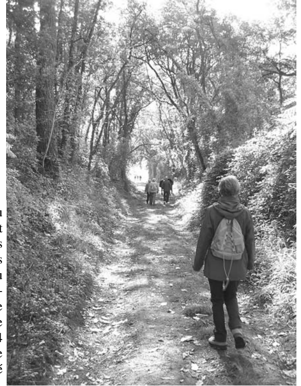
Le beau temps et les marcheurs étaient au rendez-vous le dimanche 4 novembre à Grézillé