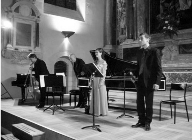
L'ensemble Sudestada le 28 septembre à Angers : un grand moment de musique

Tout au long de l'année, les Soli-Maliens se mobilisent pour mettre au point des manifestations destinées à alimenter les caisses de l'association mais aussi à provoquer des rencontres entre tous les sympathisants. Après le concert de la chorale LA GABARRE du début de l'année, ce sont deux concerts baroques qui ont été organisés fin septembre à Angers et La Roche sur Yon grâce à l'ensemble SUDESTADA : le public a été totalement conquis. Comme chaque année, le premier dimanche de novembre a été le grand rendez-vous de marcheurs puisqu'ils étaient 550 à sillonner les différents parcours à Grézillé (49) sur des distances s'échelonnant entre 6 et... 42 Km.