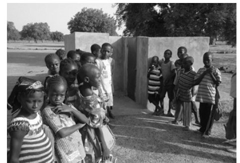
Les latrines à Wanyakuy

L'école reste dynamique malgré un effectif en baisse (lié à l'ouverture d'autres classes dans un village voisin), les latrines financées par Soli-Mali ont été mises en fonction, et le jardin de l'école a connu ses premières récoltes.